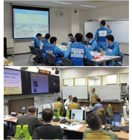
図上演習の様子(平成27年度)

図上演習が、事業者にとって効果的かつ十分に満足いく研修になるように、今後の実施状況や受講者からのコメント等を踏まえながら、更なる研修内容の改善を図っていきます。