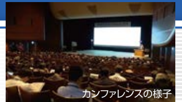
カンファレンスの様子