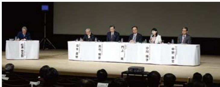
登壇者による意見交換

昨年4月のCNO(原子力責任者)会議で「JANSIのリーダーシップの下、産業界として川内への支援を行う」ことを決定。九州電力と調整し、支援の内容と時期を決定。電力各社のエキスパートと連絡体制を構築し、現場ウォークダウンの実施、原子炉起動段階からの駐在員の派遣、国内のトラブル情報を基にした想定されるトラブルの抽出などを行った。この活動内容を踏まえ、後続の高浜、伊方両発電所に対しても支援を行った。